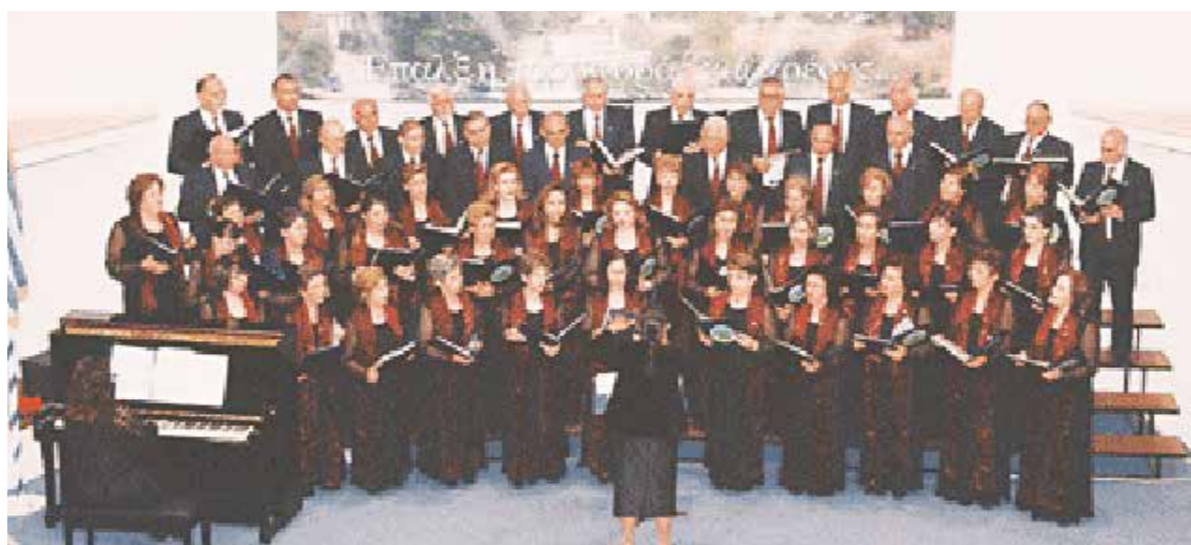
ΣΗΜΑΝΤΙΚΗ Η ΠΑΡΟΥΣΙΑ ΤΗΣ ΚΥΠΡΟΥ ΣΤΗΝ ΠΟΛΙΤΙΣΤΙΚΗ ΣΚΗΝΗ ΤΗΣ ΡΟΥΜΑΝΙΑΣ

Τα τελευταία χρόνια, χάρη στις παρουσιάσεις μεταφράσεων κυπριακών έργων, στις διαλέξεις Κυπρίων ακαδημαϊκών στην έδρα Νεοελληνικών Σπουδών του Πανεπιστημίου Βουκουρεστίου και στις εκδηλώσεις που έγιναν στα πλαίσια της κυπριακής Προεδρίας της Ευρωπαϊκής Ένωσης, η Κύπρος έδωσε έντονα το «παρών» της στη ρουμανική πολιτιστική σκηνή.