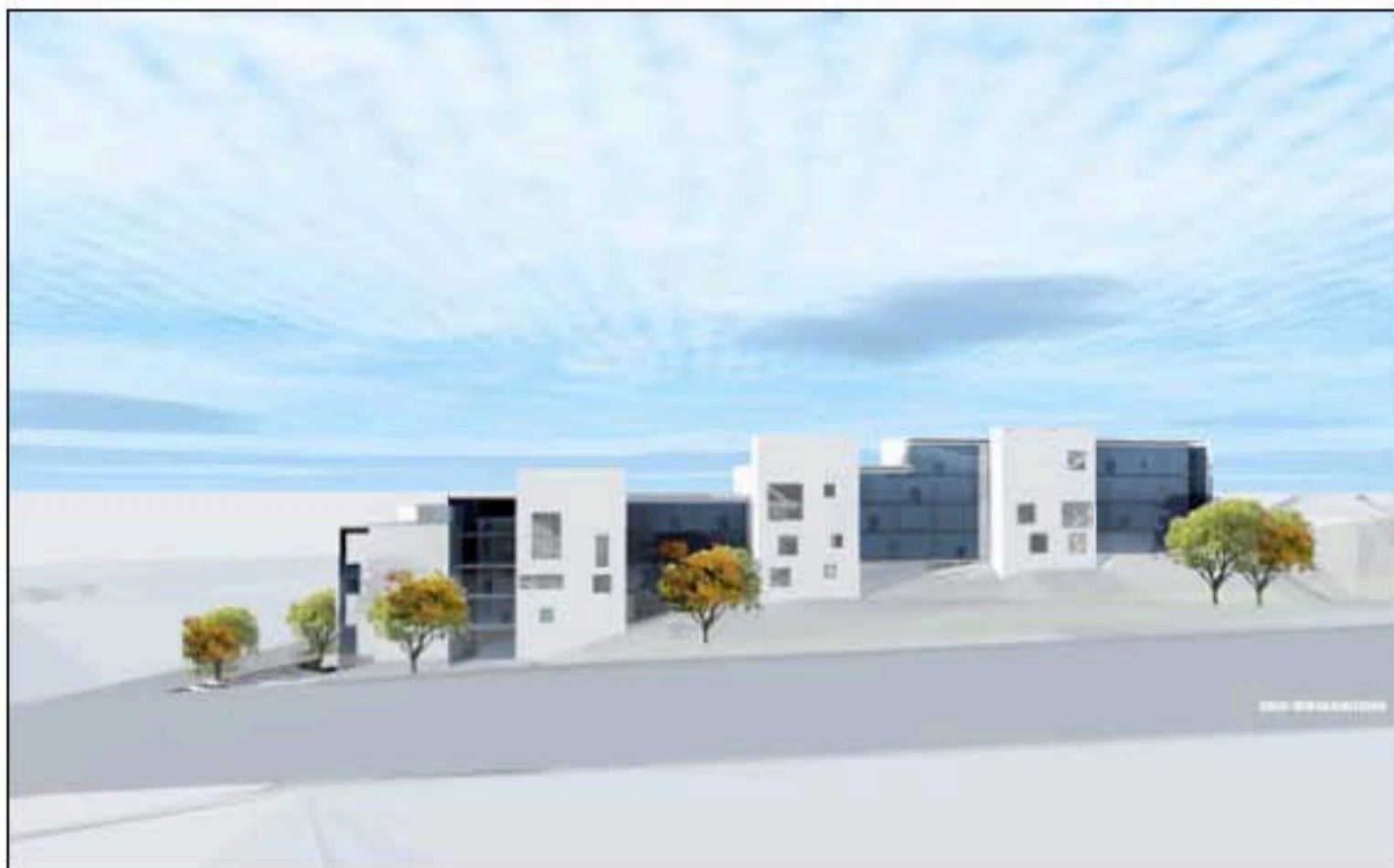
Studentbostäderna vid Ektorps skola ska byggas i tre till fem våningar.

ÅRS FÄNGELSE för grovt sjötyleri riskerar en man som nu åtalats vid Nacka tingsrätt efter att han i juli förra året ska ha kört båt berusad två gånger på Baggensfjärden.